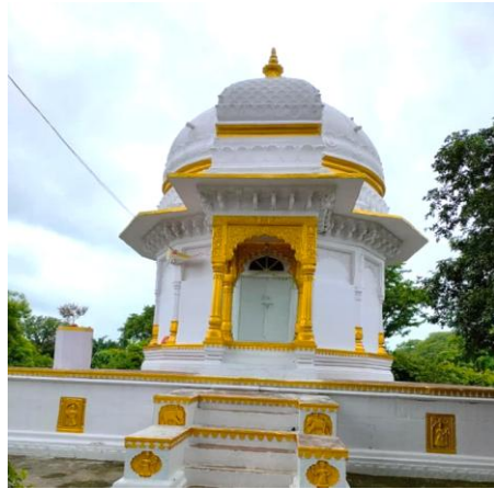
कुँवर चैनसिंह की छतरी

कुँवर चैनसिंह ने भी ब्रिटिश सत्ता के विरुद्ध संघर्ष का मार्ग अपनाया और अपने साहस एवं स्वाभिमान के कारण क्षेत्रीय प्रतिरोध के महत्वपूर्ण प्रतीक बने। वे नरसिंहगढ़ रियासत (राजगढ़) *** के राजा सुभाग सिंह के पुत्र थे, जिससे उन्हें राजनीतिक परिस्थितियों की गहरी समझ प्राप्त हुई। अंग्रेजों से उनका विरोध मुख्यतः अफीम की खरीद से जुड़े विवादों तथा दीवान आनंदराम बख्शी और मंत्री रूपराम बोहरा की दो हत्याओं की घटनाओं के कारण उत्पन्न हुआ, जिससे उनके और कंपनी प्रशासन के बीच तनाव निरंतर बढ़ता गया। इसी दौरान सीहोर के पॉलिटिकल एजेंट मैडॉक ने अपनी शक्ति का विस्तार करते हुये भोपाल, खिलचीपुर और राजगढ़ सहित आसपास के क्षेत्रों पर अधिकार स्थापित कर लिया, जिसके परिणामस्वरूप संघर्ष की स्थिति और अधिक तीव्र तथा निर्णायक बन गई। बढ़ते तनाव और राजनीतिक टकराव के बीच अंततः 24 जून 1824 को सीहोर में कुँवर चैनसिंह और अंग्रेजों के मध्य भीषण युद्ध हुआ, जिसमें उन्होंने अदम्य वीरता का प्रदर्शन करते हुये युद्धभूमि में वीरगति प्राप्त की। इस युद्ध में उनके अंगरक्षकों हिम्मत खां एवं बहादुर खां का भी महत्वपूर्ण योगदान था। आज भी सीहोर में स्थित कुँवर चैनसिंह की छतरी *** उनके बलिदान, साहस और औपनिवेशिक सत्ता के विरुद्ध उनके संघर्ष की स्मृति को जीवित रखे हुये है।