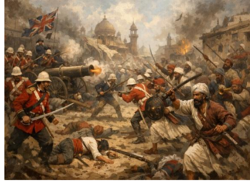
अंग्रेजों के विरुद्ध विद्रोह : काल्पनिक रूपांतरण

1857 के इस विप्लव का तात्कालिक कारण गाय और सुअर की चर्बी लगे कारतूस बने, जिनके प्रयोग की बाध्यता ने सैनिकों की धार्मिक भावनाओं को आहत किया। इसी क्रम में 10 मई 1857 को मेरठ छावनी में सैनिकों द्वारा विद्रोह किया गया, और इस विद्रोह की ज्वाला शीघ्र ही अन्य क्षेत्रों की भाँति मध्यप्रदेश तक भी पहुँच गई।