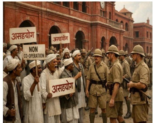
असहयोग आंदोलन : काल्पनिक रूपांतरण